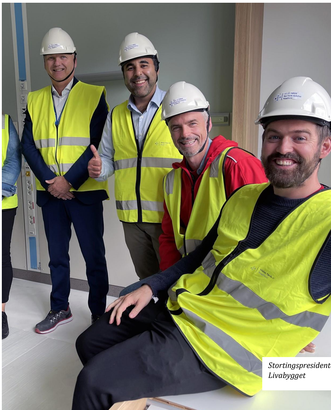
Stortingspresidenten på besøk i Livabygget

PROSJEKT: Nye Førde sjukehus FØRETAK: Helse Førde HF DATO: 08.09.2023