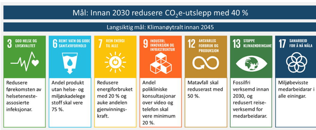
Figur 1: Spesialisthelsetenesta og Helse Førde sine miljømål 2022-2030.

Figuren viser nasjonale miljømål for spesialisthelsetenesta som Helse Førde arbeider for å nå ved hjelp av overordna tiltak og miljøhandlingsplanar ute i einingane. I tillegg til å arbeide mot felles miljømål har også Helse Førde fokus på avfallshandtering og gjenbruk. Årleg vert det rapportert på spesialisthelsetenesta sine felles indikatorar og klimarekneskap for å halde kontroll på utviklinga. Helse Førde har ein eigen rådgjevar for miljø og samfunnsansvar som deltek i det regionale nettverket for klima og miljø.