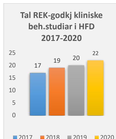
Figur 3. Tal REK-godkjende kliniske behandlingsstudiar i Helse Førde, 2017 - 2020

Data er henta frå rapporteringar i www.cristin.no , samt kartlegging hos lokale prosjektleiarar. Ein ser ein kraftig nedgang i 2019 og 2020. Hovudårsaka er at fleire pågåande studiar med betydeleg rekruttering avslutta inklusjon av nye pasientar i løpet av 2019, og det er ikkje starta opp nye som rekrutterer eit høgt tal deltakarar.