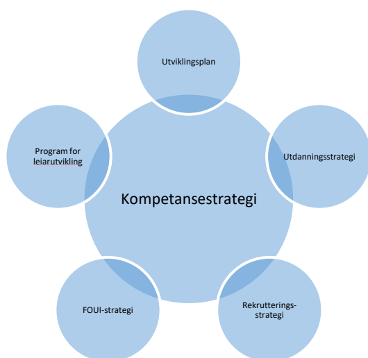
Figur 2: Samanheng mellom overordna kompetansestrategi og andre strategiar som dekker området kompetanse.