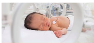
The ALIENS Study – Artificial Intelligence in Neonatal Sepsis

Vi sendte inn tre søknadar om innovasjonsmidlar hausten 2019 til prosjekta «Pust deg bedre», The ALIENS Study, og PainPad. To av prosjekta fekk midlar som sikrar vidare framdrift i prosjekta. «Pust deg bedre» fekk 950.000 kroner, og the ALIENS study fekk 500.000 kroner.