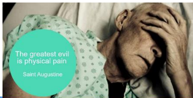
Pasientstyrt automatisert smerteregistrering - PainPad®