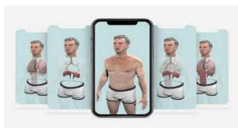
Pust deg betre- eit digitalt verktøy for lungesjuka