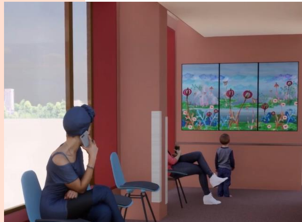
Skisse frå Simone Hooymans, videokunst i 5. etasje