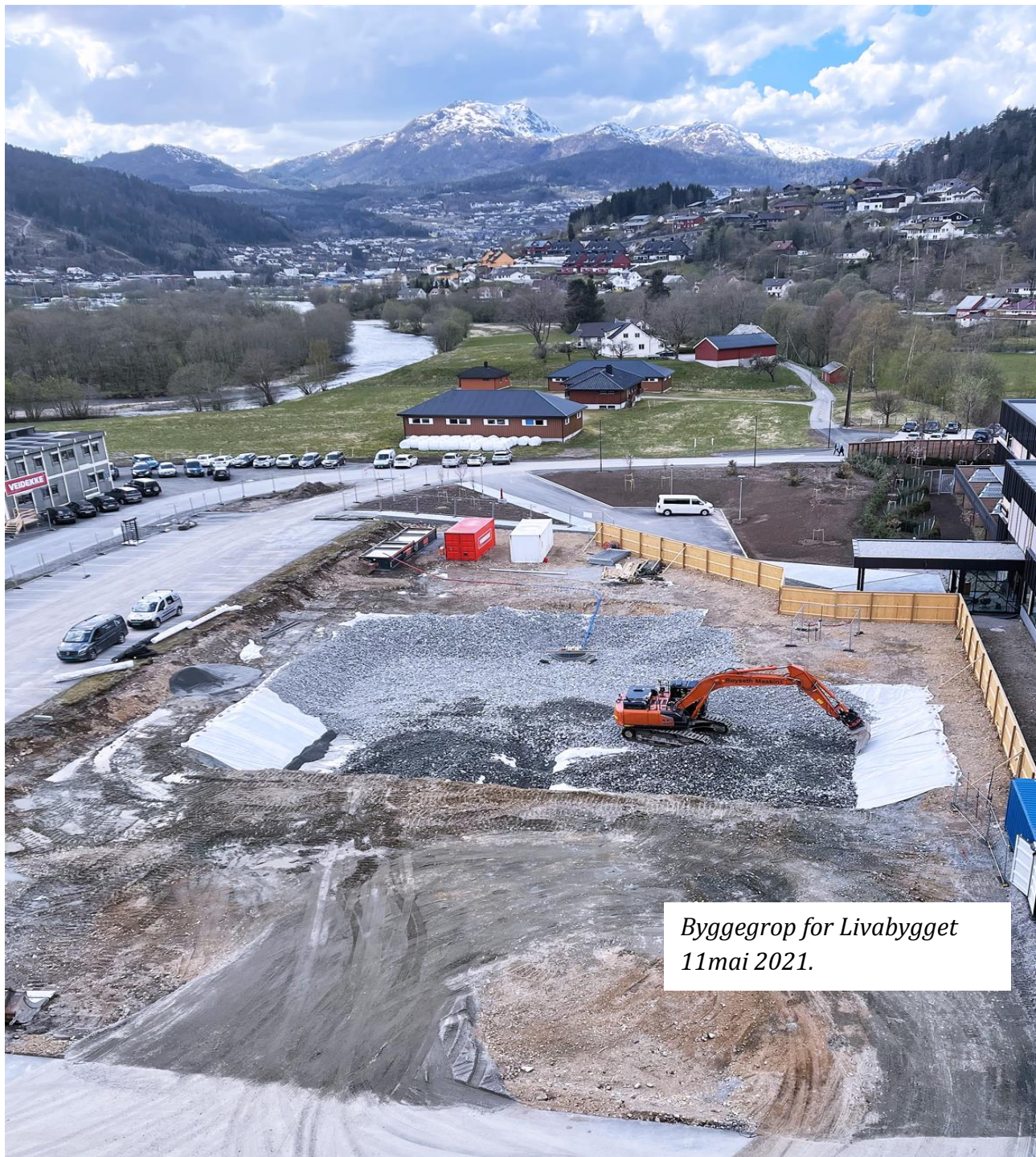
Byggegrøp for Livabygget 11mai 2021.

PROSJEKT: Nye Førde sjukehus FØRETAK: Helse Førde HF DATO: 12.05.2021